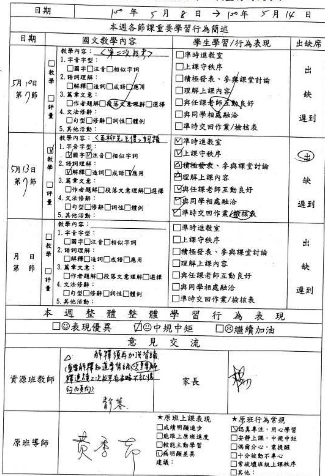
台南縣立新化國民中學資源班學生教室行為觀察表