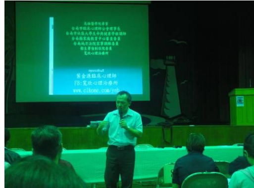
說明：葉心理師演講