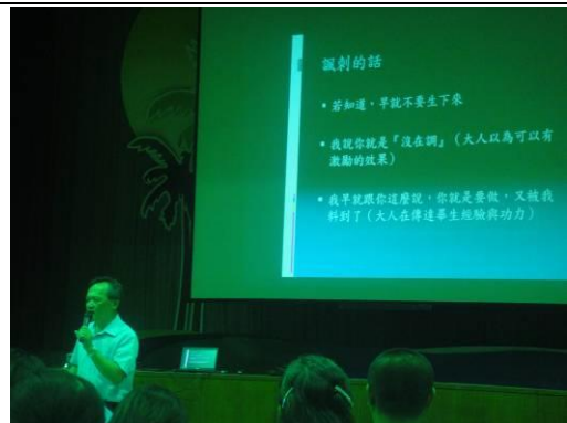
說明：葉心理師演講