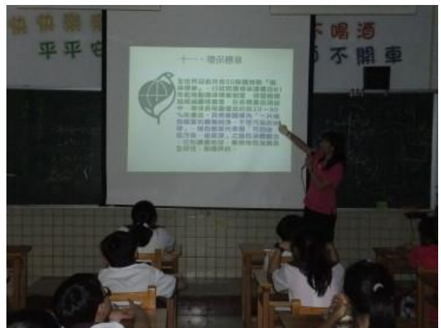
環保標章的綠色產品從原料的取得、製造、使用