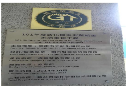
榮獲節能建築綠標章-銀級。