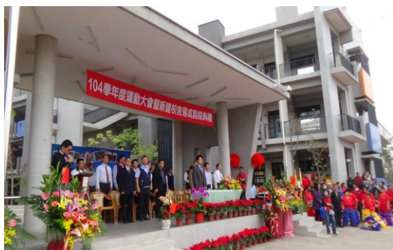
2015. 12. 25 全新落成新校舍，榮獲 節能建築綠標章。

為落實推動政府節能減碳教育，展現校園節能減碳之成果，以營造校園節能減碳特色，新化國中腹地廣大（校地 4.74 甲），要克服地下水管管線老舊有時破裂漏水與廁所水箱老舊常常漏水等因素，全校師生仍朝省水，節省能源的目標邁進並落實節能校園之教育宣導與行動。