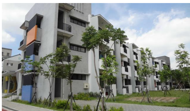
全新落成新校舍—新學樓北棟