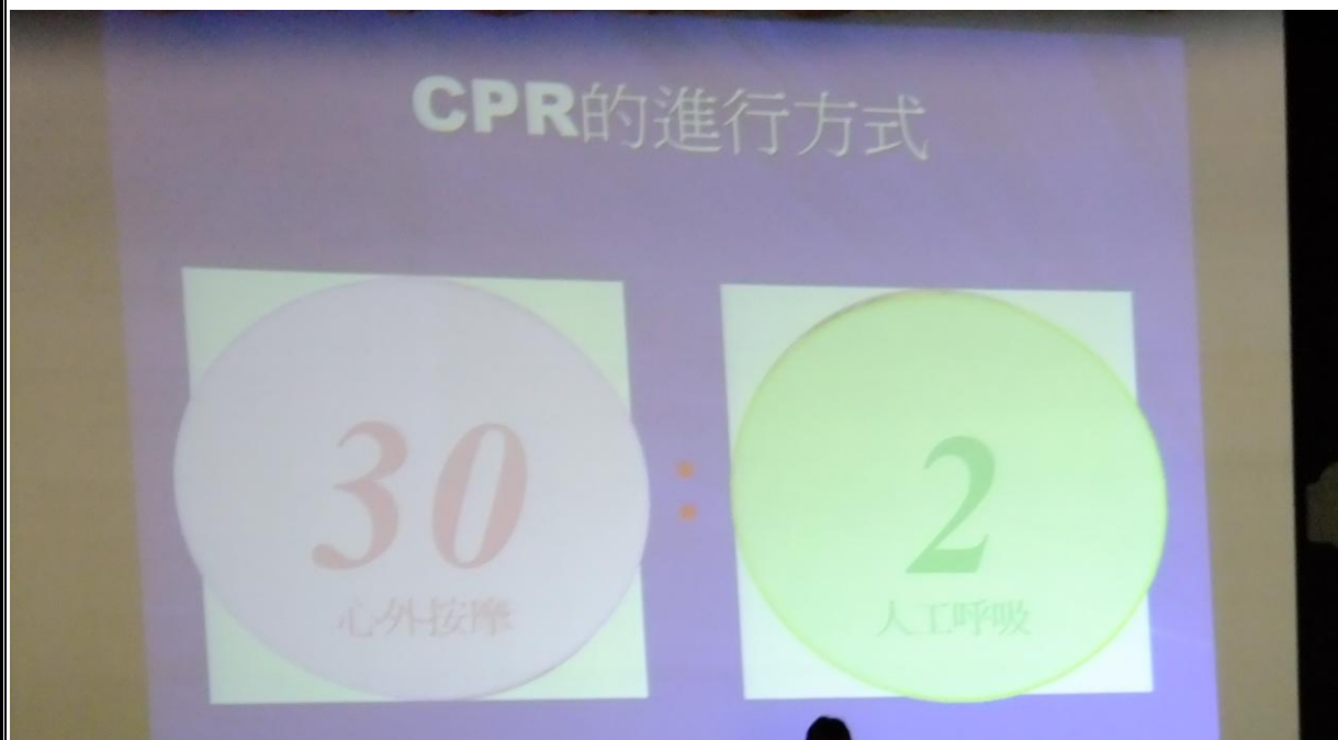
說明：30 次心外按摩後再進行 2 次人工呼吸。