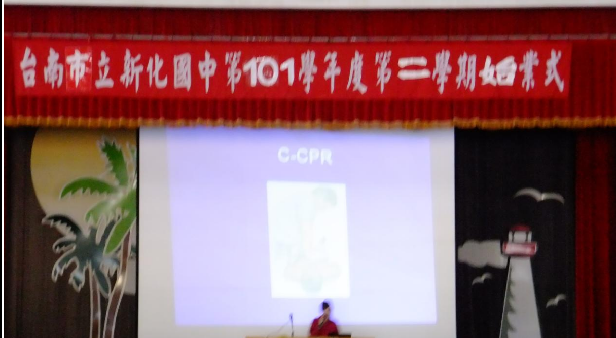
說明：消防隊隊員到校進行 CPR 教學。