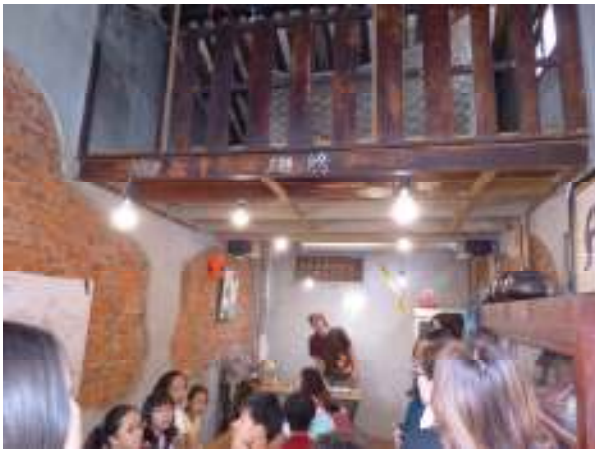
體驗之旅：慕紅豆的漂流之旅