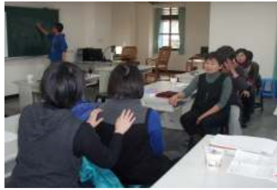
研習(從平面閱讀到動態表演)