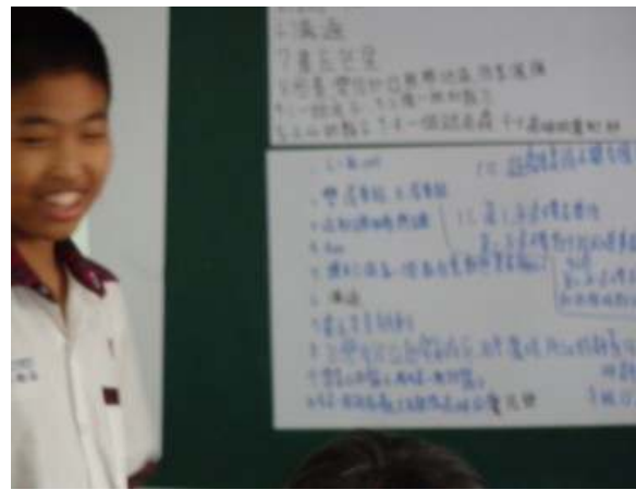
閱讀心得寫作發表