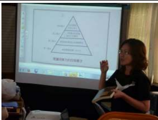
教師專業成長學習社群