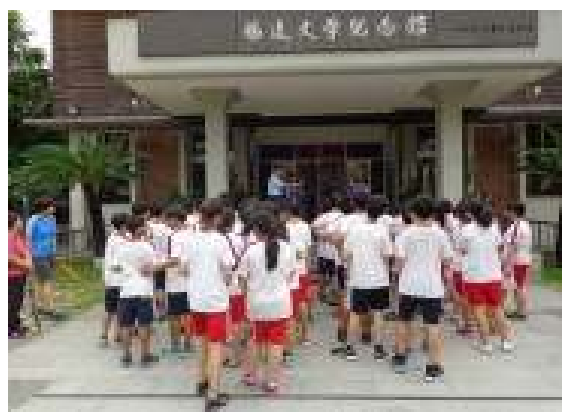
參訪活動(楊逵文學館)