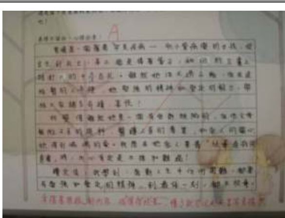
閱讀課學生學習單