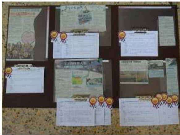
班級讀報心得看板