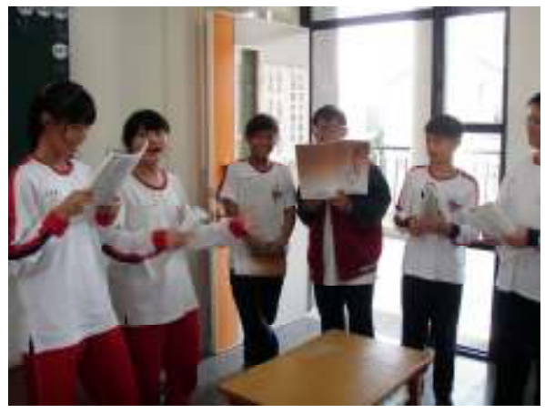
說明：學生以戲劇的方式呈現內容