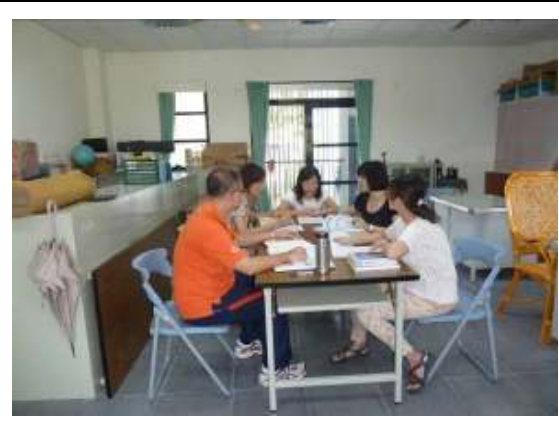
教師讀書會(十五顆小行星)