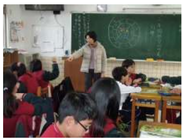
說明：進行小組分享