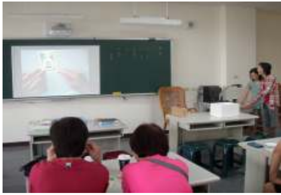
研習(桌遊融入閱讀教學之運用)