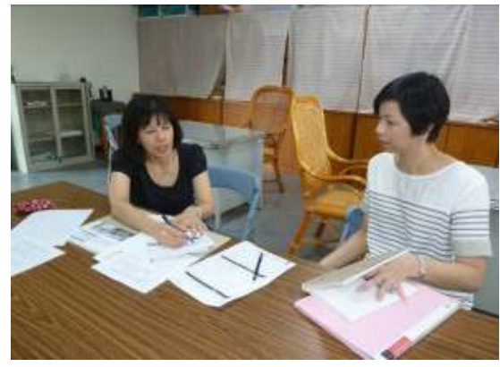
教師讀書會(十五顆小行星)