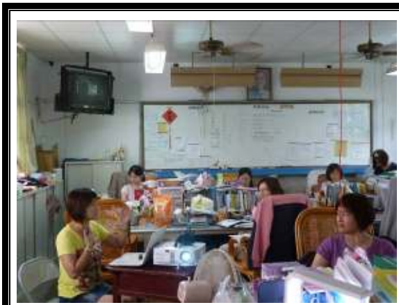
教師專業成長學習社群