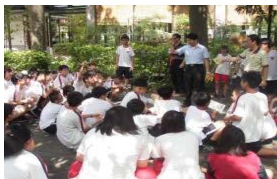
參訪活動(新化高工楊逵文學步道)