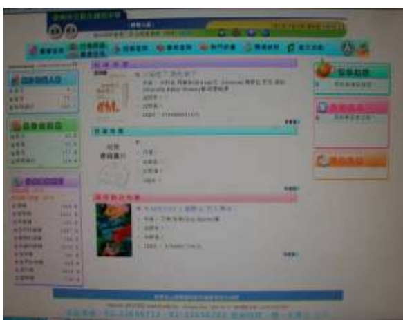
教育部圖書館系統資訊建置與使用