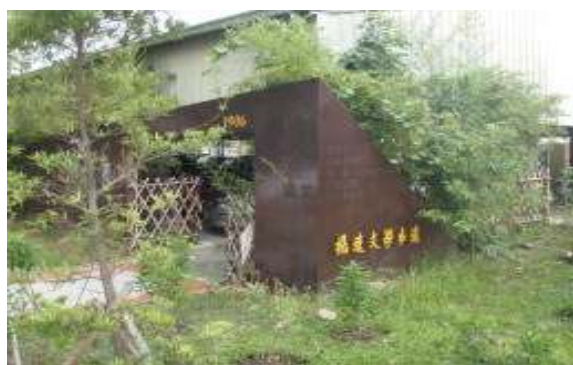
參訪活動(新化高工楊逵文學步道)