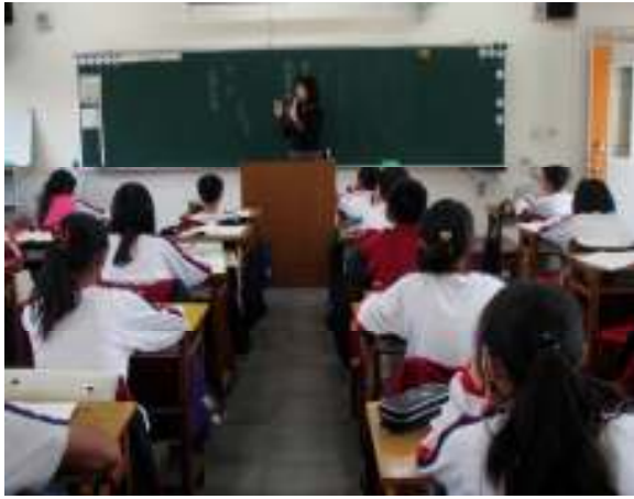
說明：老師先講解課程進行的方式