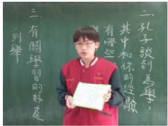
說明：學生分組上台報告