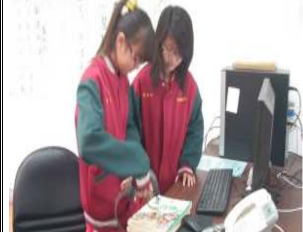
延長開放時間(寒暑假志工)