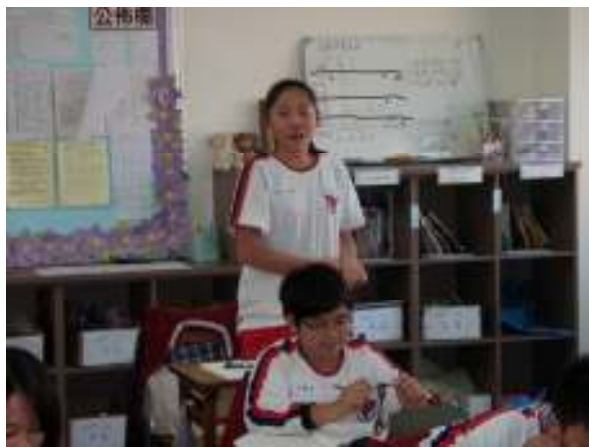
說明：學生發表意見