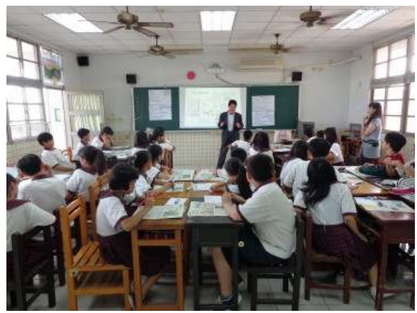
班級閱讀發表心得