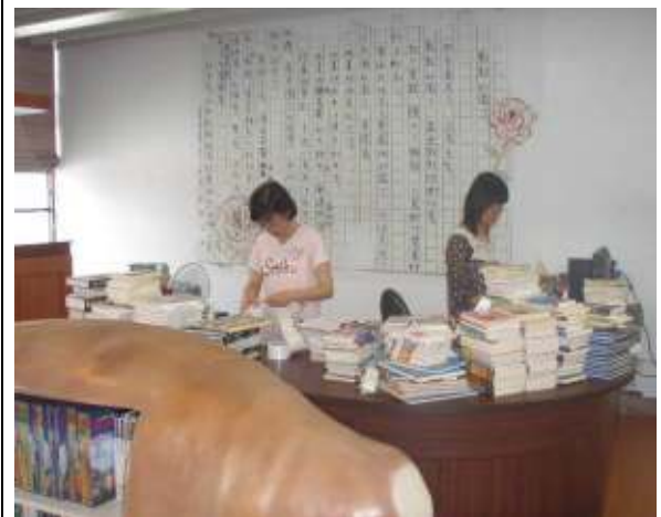
家長捐書、義工媽媽