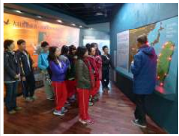
七股賞鳥：黑面琵鷺