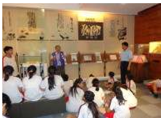
參訪活動(楊逵文學館)