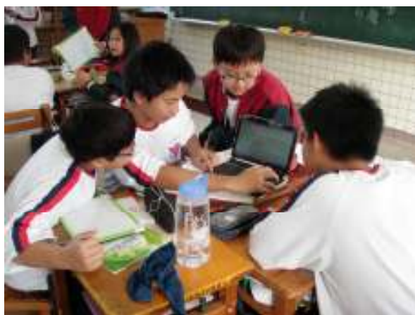
說明：利用電腦和平板進行分組合作學習