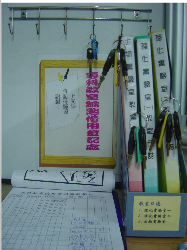
教師需親自 向設備組登記借用及歸還鑰匙