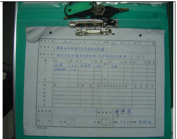
確實填寫實驗日誌