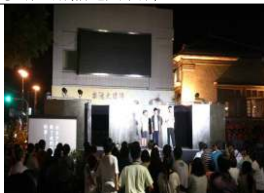
楊達作品(送報伙)學生公演