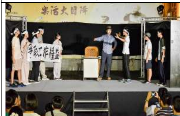
楊達作品(送報伙)學生公演