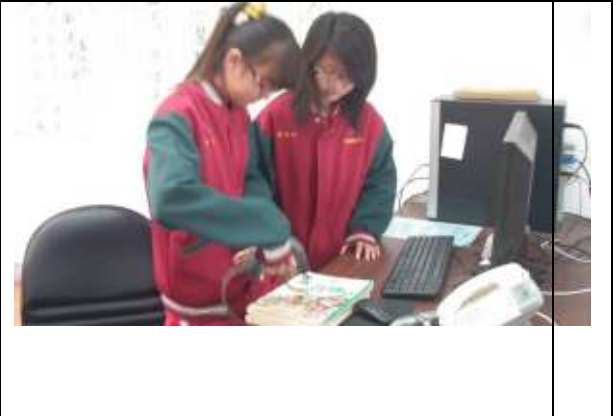
延長開放時間(寒暑假志工)