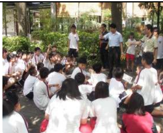
參訪活動(新化高工楊達文學步道)