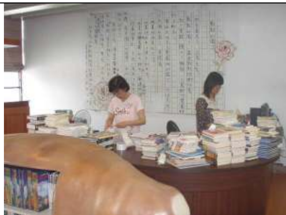
家長捐書、義工媽媽