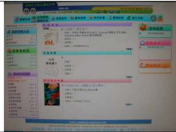
教育部圖書館系統資訊建置與使用