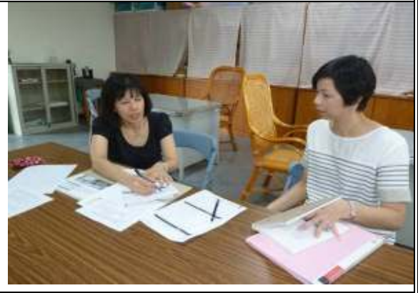
教師專業成長學習社群