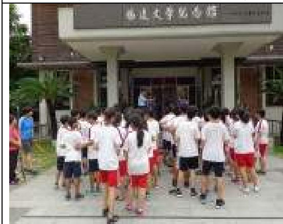
參訪活動(楊達文學館)