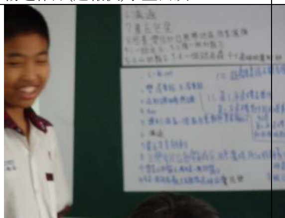
閱讀心得寫作發表