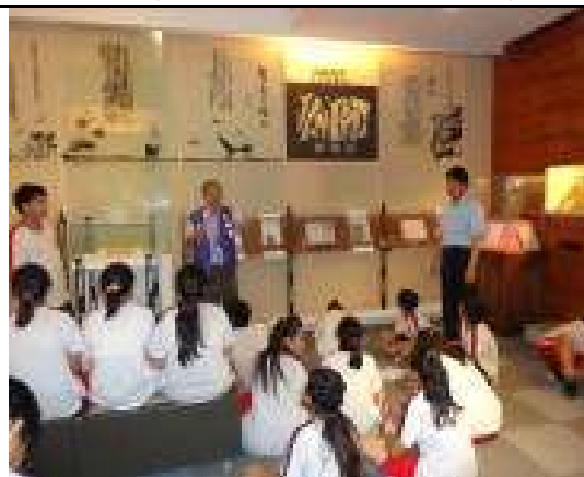
參訪活動(楊達文學館)