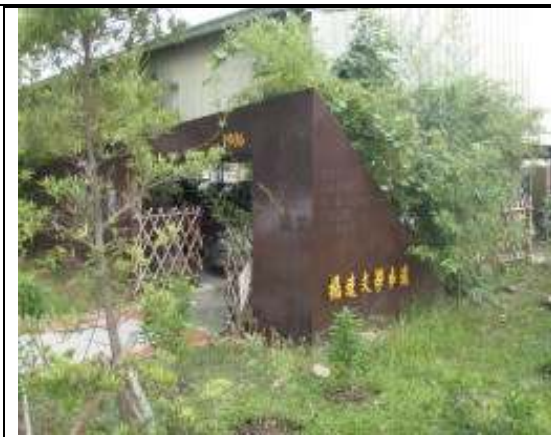
參訪活動(新化高工楊達文學步道)