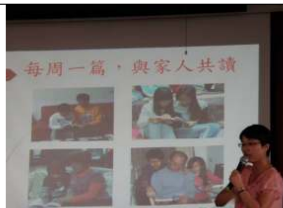
研習(讀報教育實驗教學分享)